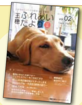
表紙の写真は、当院のアイドル！セラピードッグのリリーです。

このお便りも、皆さんに楽しんでもらえるような情報をお伝えしていきたいと思しますので、これからもどうぞよろしくお願いたします。