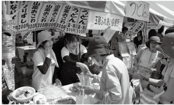
自慢の山菜おこわを求め、多くの方が足を運んでくれました