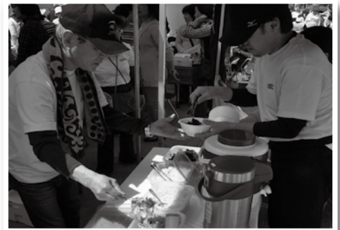
うどんのオーダーが入り大忙しの職員