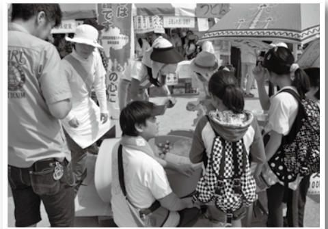
好天気に恵まれ、冷たい飲み物に誘われてジュース売場も大忙し