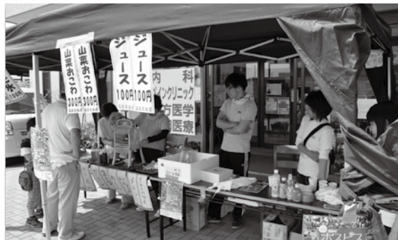
診療所前では、救急当番医を担当しながら、出店も行いました