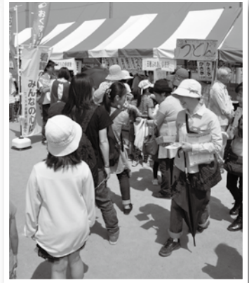
長蛇の列は売上げ好調の証

地域を大切にするお祭りに参加することで地域を知る、人を知る、人とのつながり絆を感じられる1日を過ごしました。